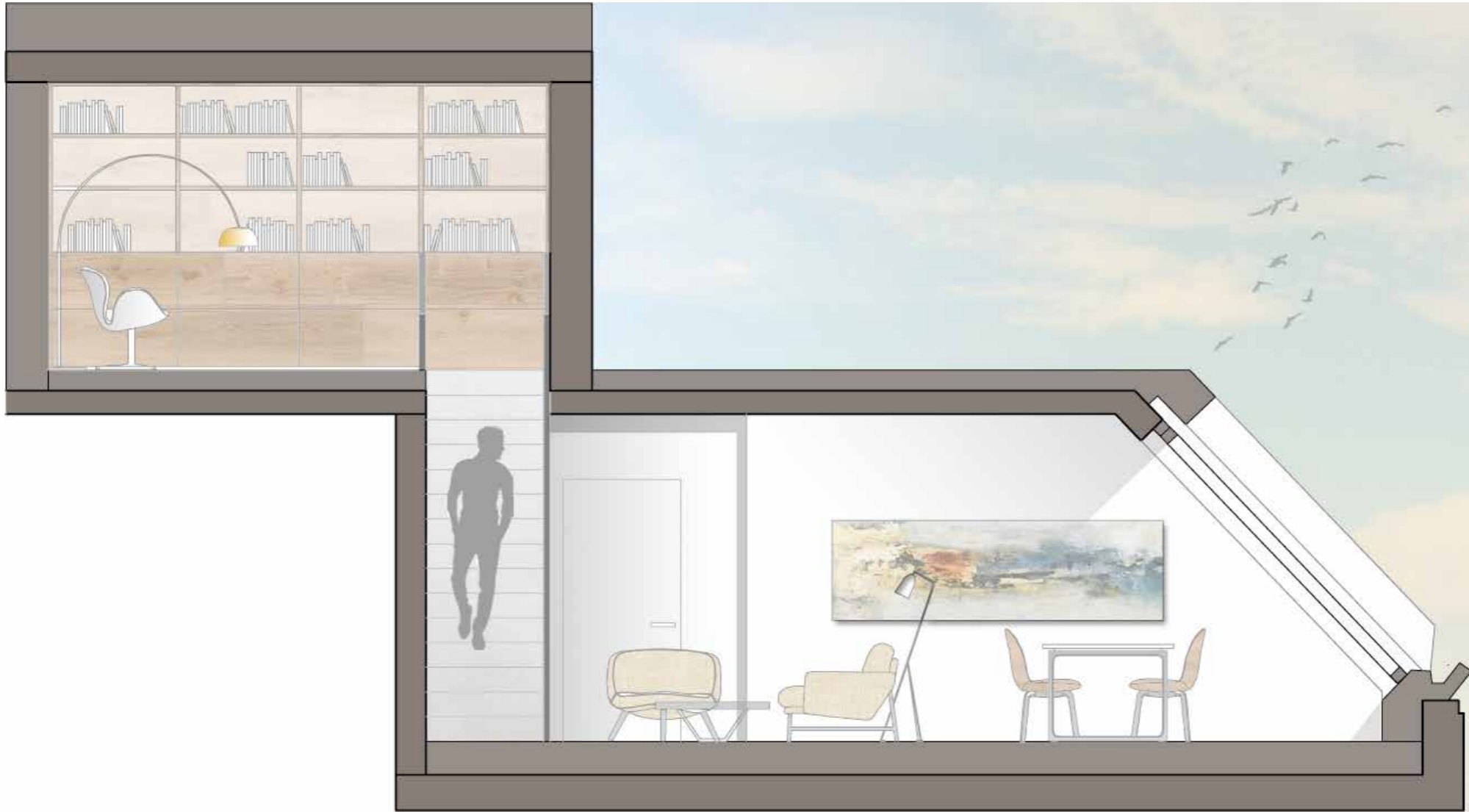
Schnitt TOP S07, 2.OG