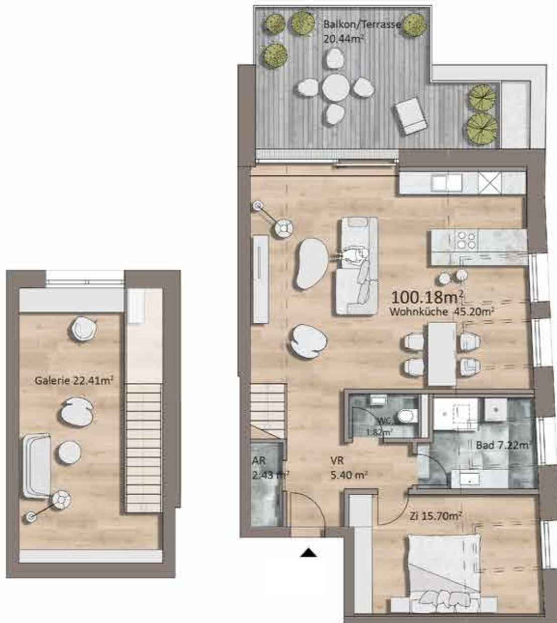
Grundriss TOP S07, Galerie