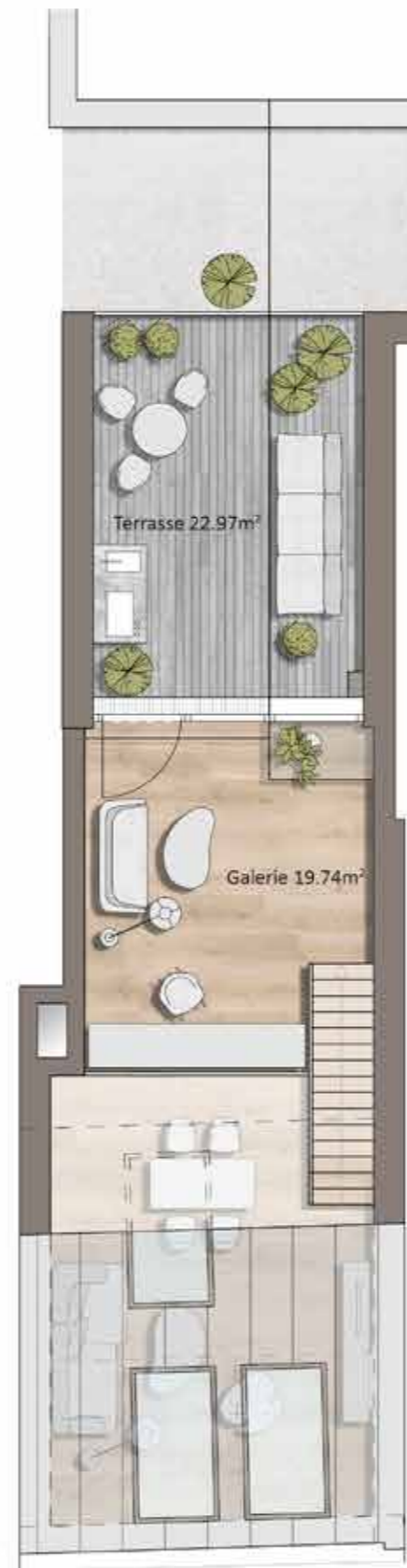
Grundriss TOP S02, Galerie