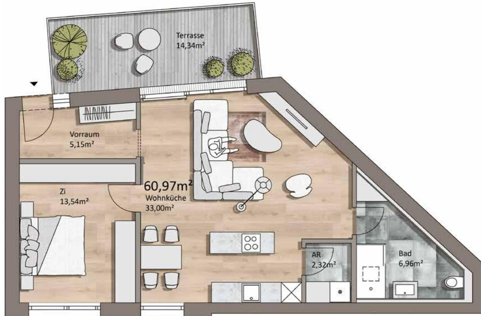
Grundriss TOP L04, Erdgeschoss