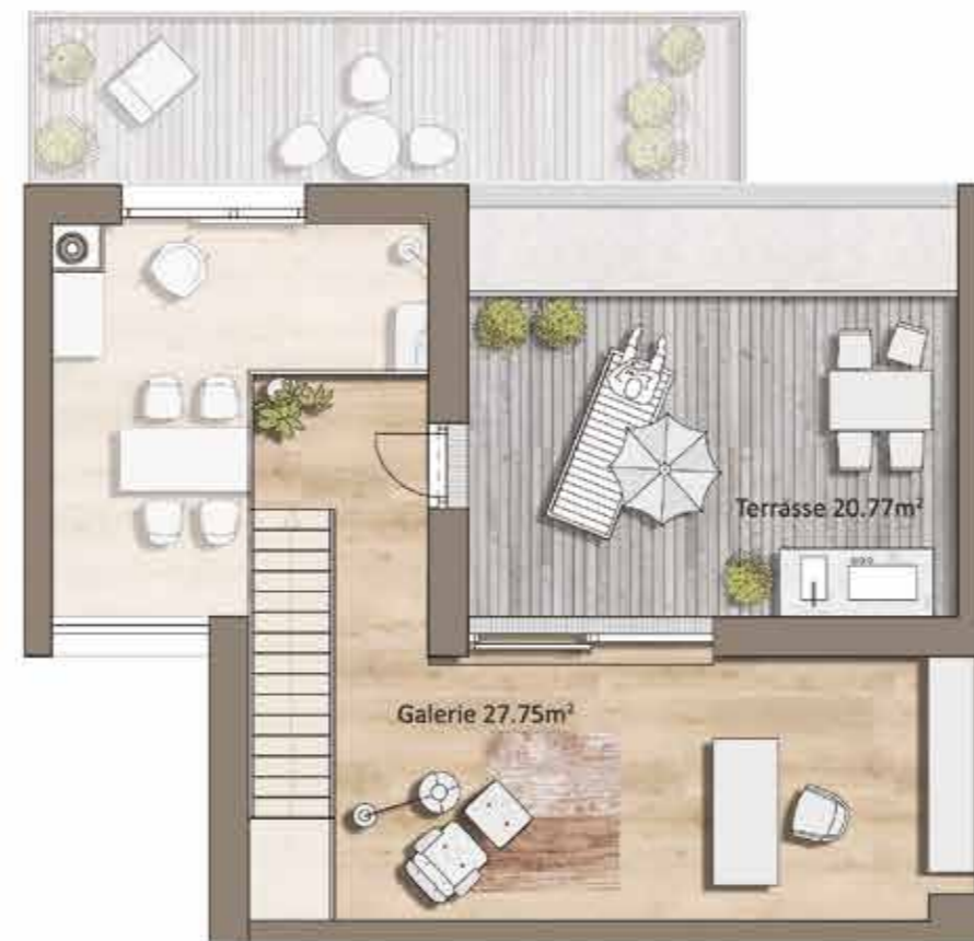
Grundriss TOP H13, Galerie