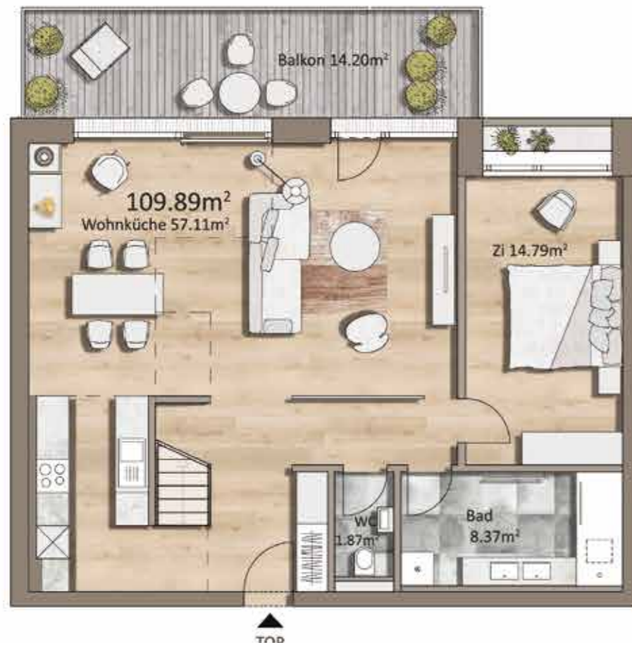
Grundriss TOP H13, 2.OG

Gesamtwohnfläche 109.89m 2 Balkon / Terrasse 34.97m 2