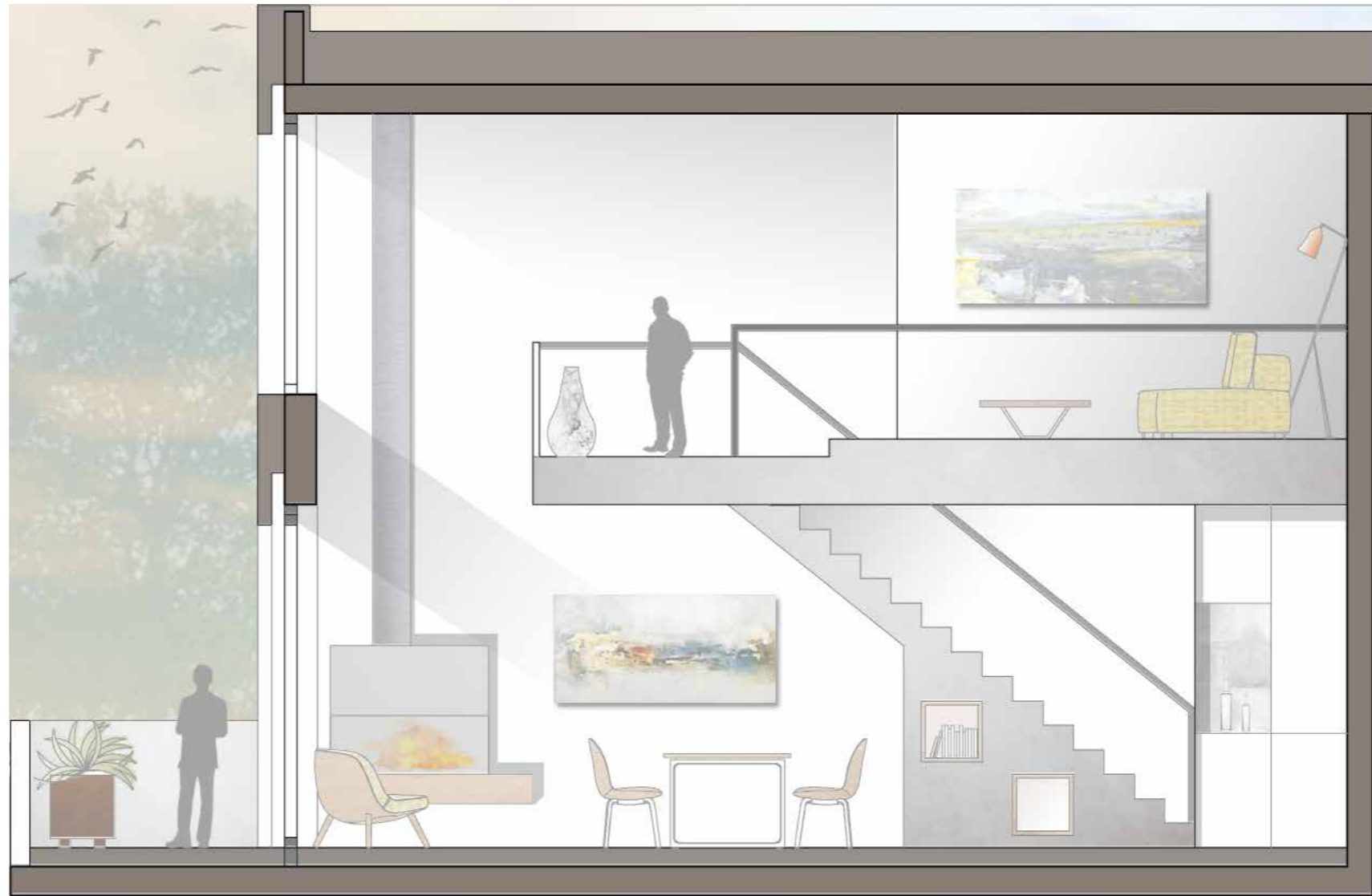
Schnitt TOP H13, 2.OG