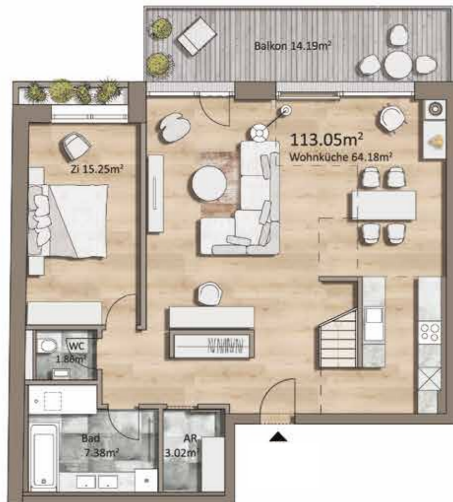
Grundriss TOP H12, 2.OG