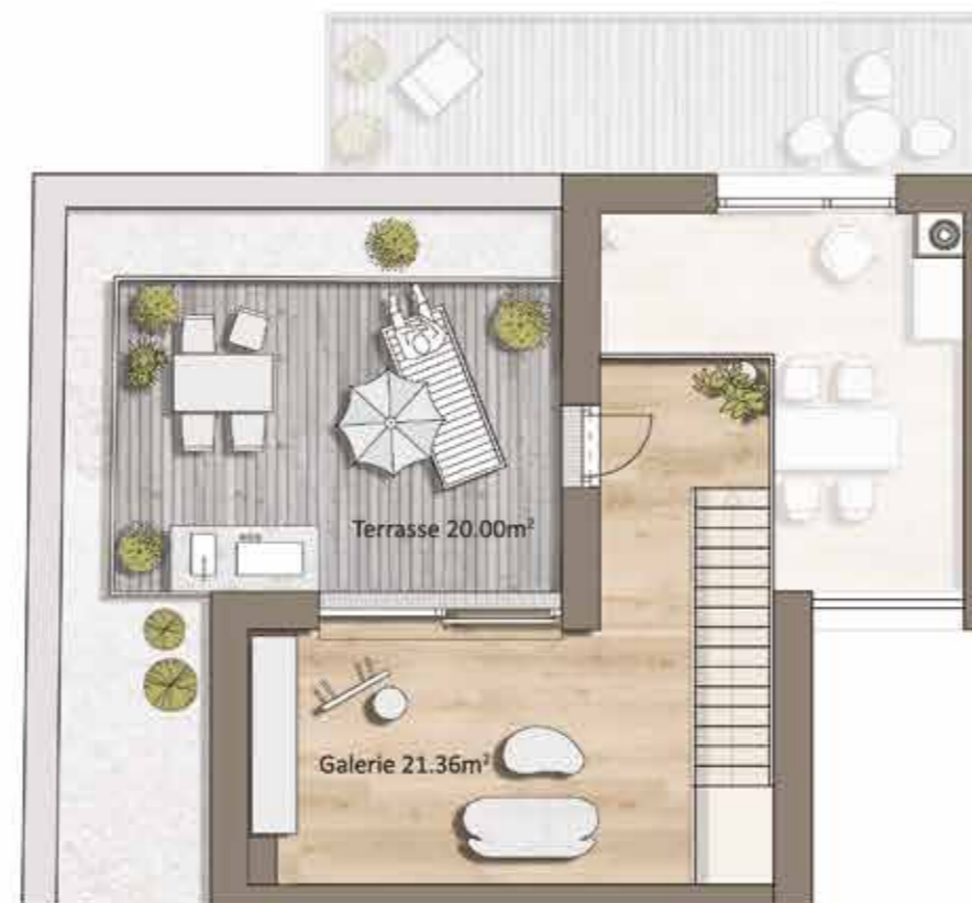
Grundriss TOP H12, Galerie