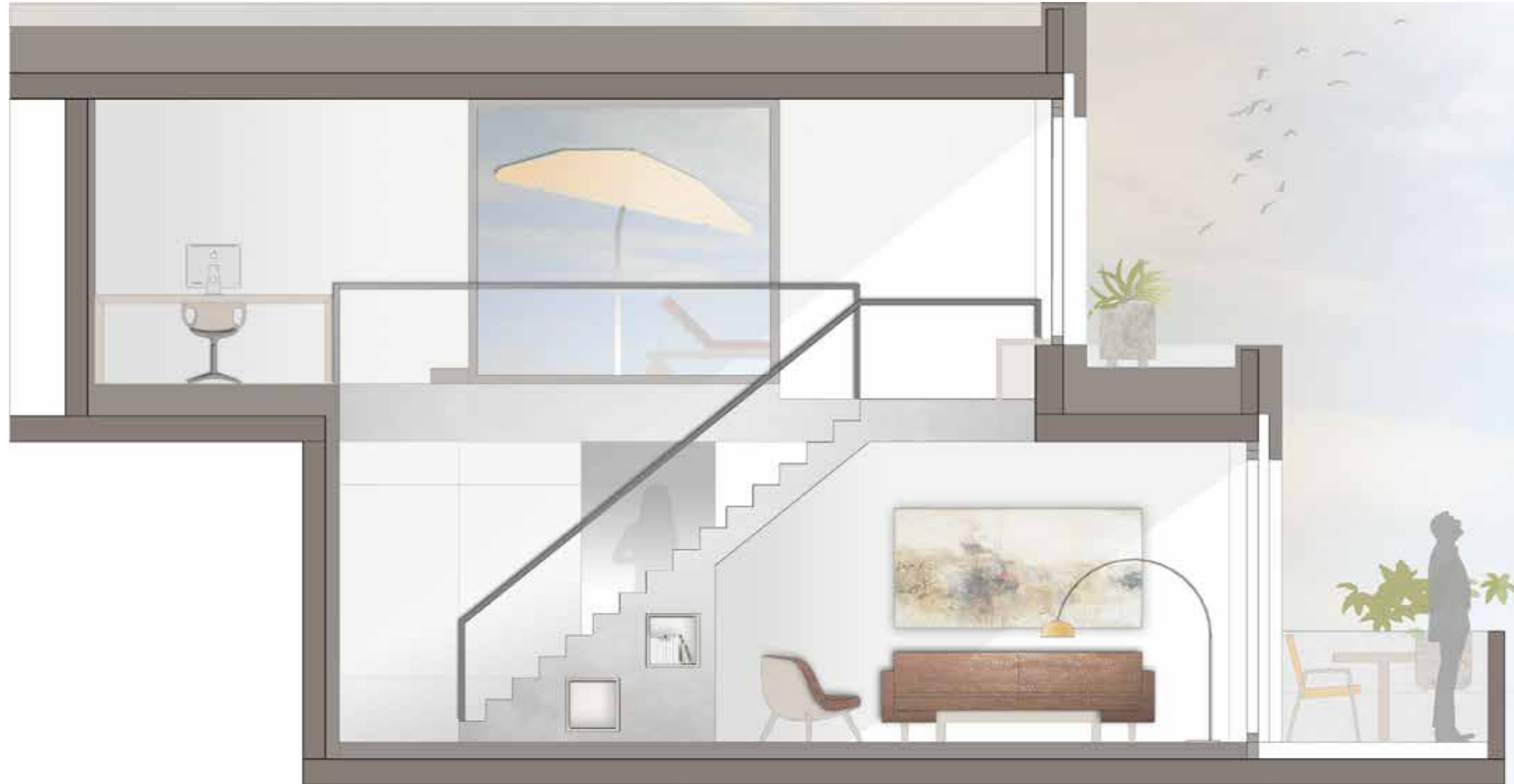
Schnitt TOP H10, 2.OG