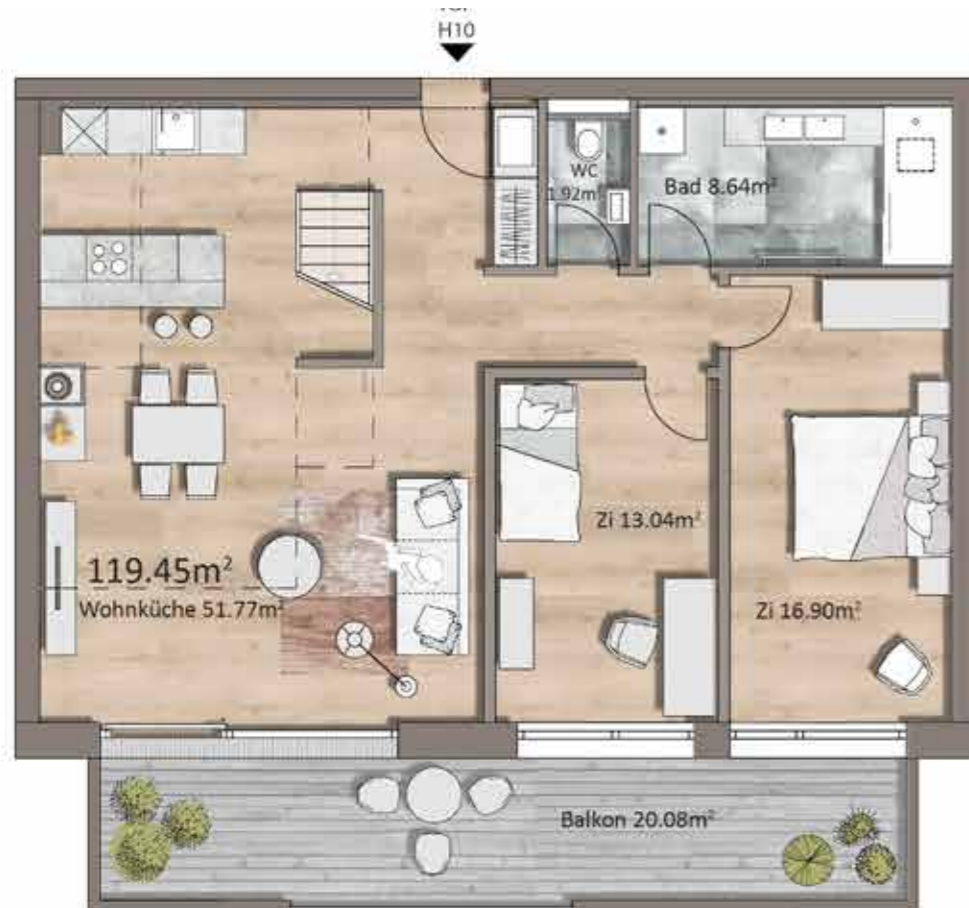
Grundriss TOP H10, 2OG

Gesamtwohnfläche 119,45m 2 Balkon / Terrasse 47,69m 2