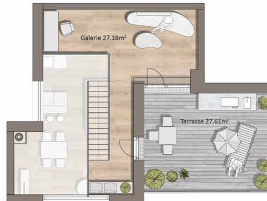
Grundriss TOP H10, Galerie