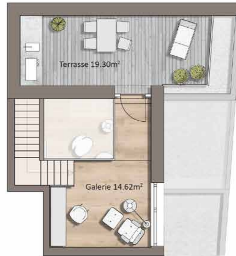
Grundriss TOP H08, Galerie