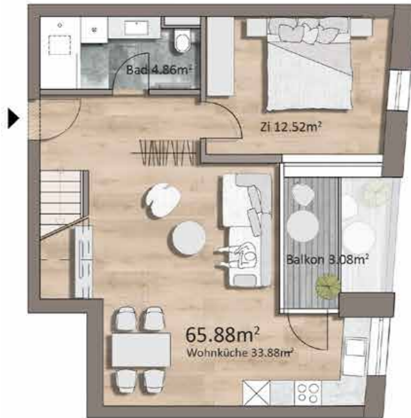
Grundriss TOP H08, 2.OG