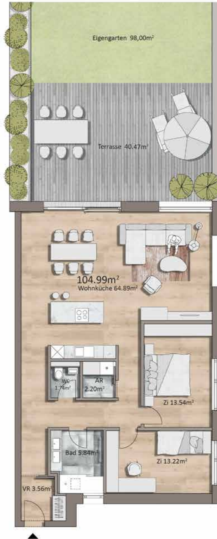
Grundriss TOP G02, Erdgeschoss