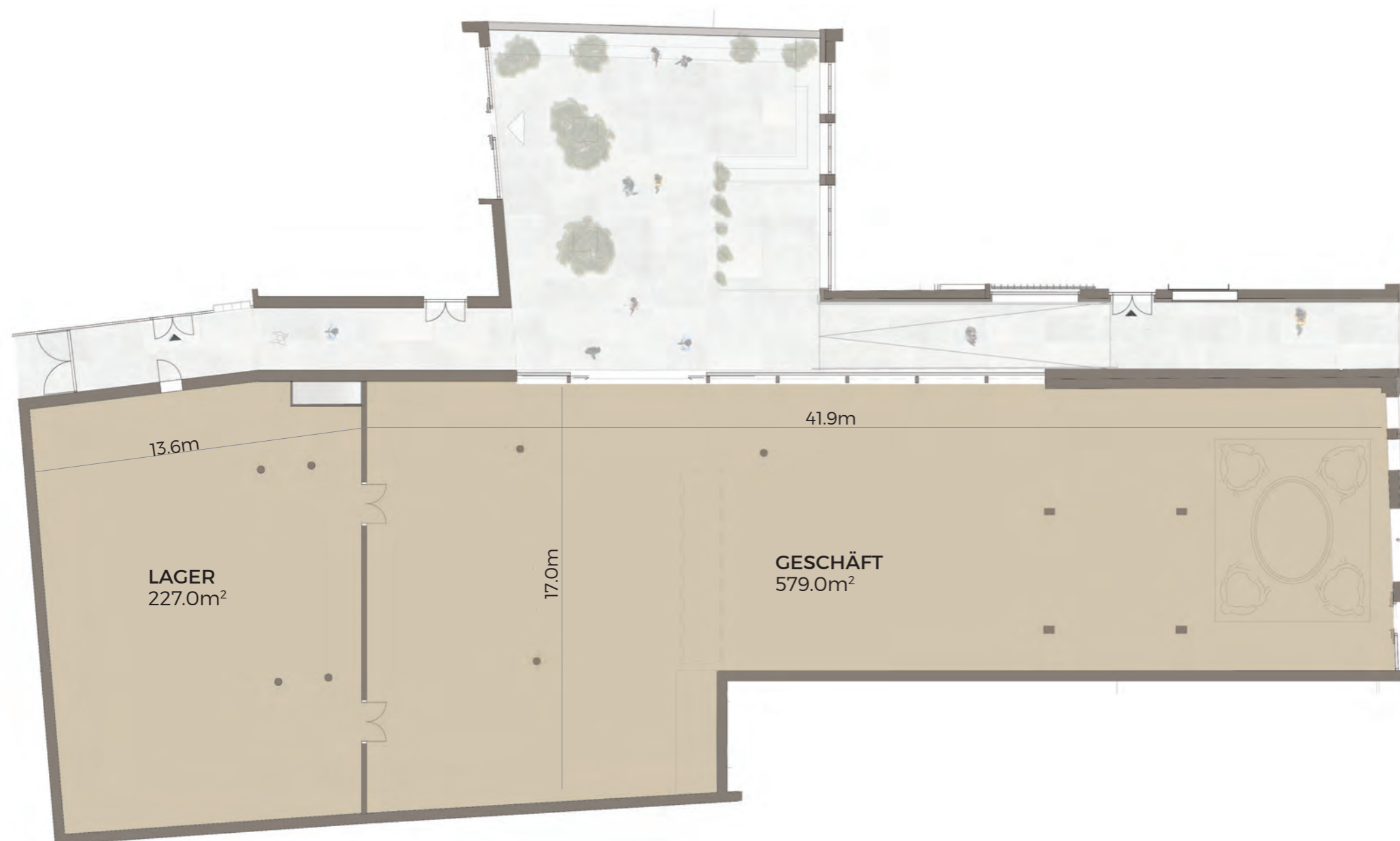
Grundriss SHOP 1, Erdgeschoss